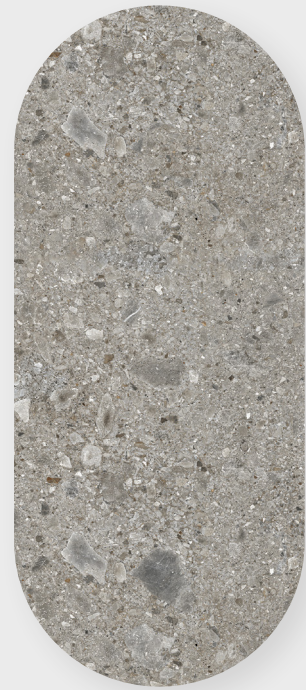
CEPPO DI GRE

Belleza unificada que perdura después del procesamiento y corte